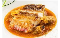
夕食:「羽田市場直送」 ホウボウのブイヤベース仕立て