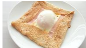
朝食: JALオリジナル ライ麦ガレット

【提供場所】羽田空港4階ファーストクラスラウンジ ダイニングエリア 【提供時間】朝食:07:00～11:30 夕食:17:30～23:30