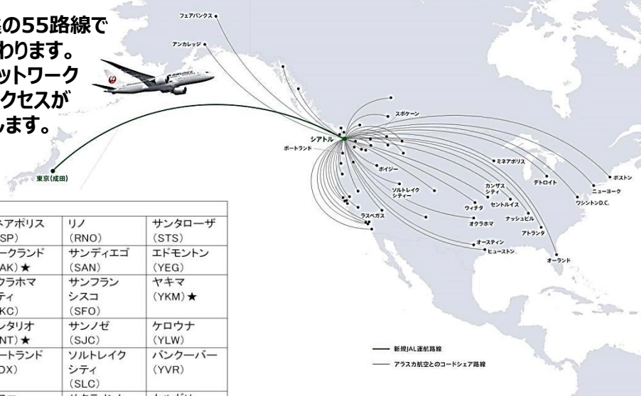
【コードシェア便就航地点一覧】

今回拡大するコードシェアはシアトル以遠の55路線で19地点が新たにJALのネットワークに加わります。JALの成田=シアトル線開設と今回のネットワーク拡大により、シアトルから北米各地へのアクセスがさらに広がり、お客さまの利便性が向上します。