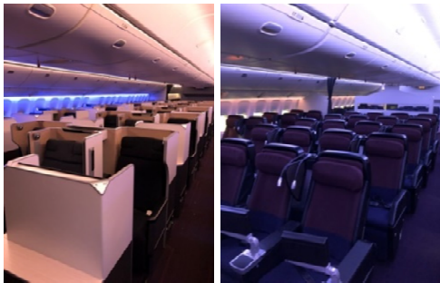
シーン例：搭乗・降機/リラクスタイム

New! 機内照明がフルカラーLEDに。 シーンに応じた異なる演出で お客さまをおもてないたします。