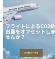
JALカーボンオフセット スマートフォントップページ