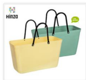
HINZAマルチバッグL 2Pセット(レモン&オリーブ) バイオプラスチック製

上記の情報は、2023年3月6日時点の情報に基づきます。最新の情報はJAL Webサイトでご確認ください。