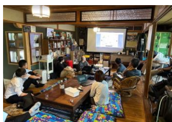
会員間の交流の様子

ワークスタイル研究会では、さまざまな企業・地域のワーケーションをはじめとする取り組み事例を学ぶことができるほか、イベント、セミナー、モニターツアーなどの情報共有や会員間の交流などを行っております。また、月に1度、オンラインにて全会員が集える会を開催し、定期的に会員間で意見交換を行っています。課題やテーマに賛同した会員同士で「ワーキンググループ」を立ち上げ、一緒にワーケーションとして地域へ訪問しつつ、各会員の課題解決を図っています。今年度は会員の要望に合わせ、ワーケーションのみならず、働き方全般に関するテーマなども多く取り扱っており、よりよい働き方を日々検討しております。