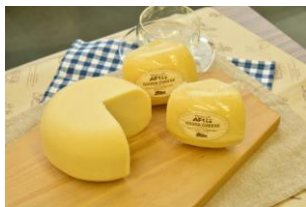
◆中標津産のチーズ